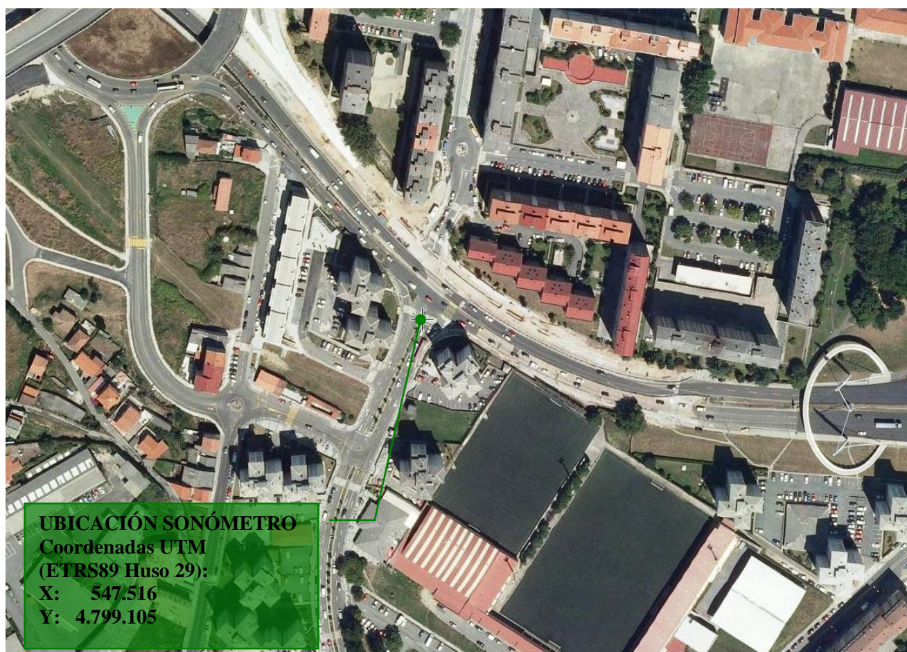
Figura 2 – Ubicación del sonómetro.

La ubicación del punto de medida se puede ver en la siguiente imagen: