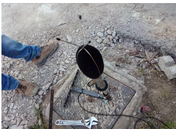
Figura 4 – Anclaje del micrófono al equipo telemático.