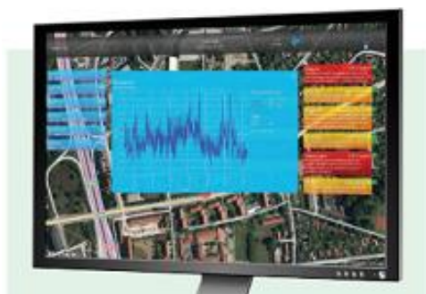
Figura 1 – Software asociado a un equipo de monitorización.

En la Figura 1 se puede observar una imagen del software asociado al equipo de monitorización continua.