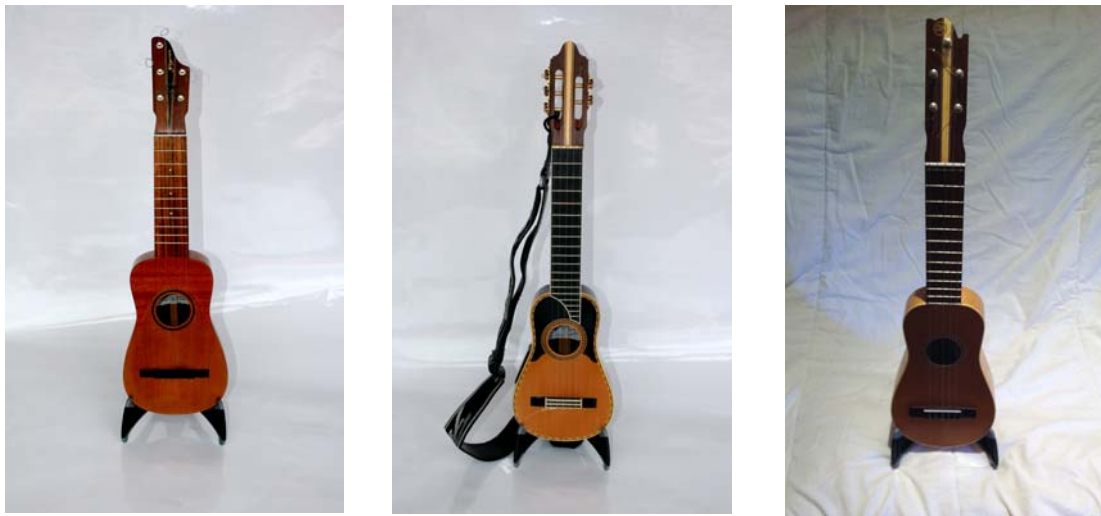
Figura 1: Tipples utilizados en este estudio: a) Faycan, b) Fariña y c) J.J. Dios

En la literatura se destacan varios estudios que tratan sobre el proceso de construcción [1], aunque la mayor parte de los trabajos dedicados a este instrumento se basan en razones musicológicas, organológicas [2] o son guías de estudio de la técnica musical necesaria para tocarlo [3]. Hasta donde sabemos, no existen estudios acústicos de este instrumento. El principal objetivo de este trabajo consiste en el estudio acústico del instrumento, en particular, en el estudio objetivo de parámetros acústicos relacionados con el timbre. Asimismo, constituye un objetivo del estudio configurar una base documental de sonidos del instrumento.